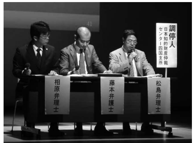
(調停人同士の打ち合わせ場面)

調停第2回期日は、被申立人が先使用権の証拠を調停人に提出する場面であり、ハイライトシーンの一つである。調停第2回期日後の解説シーンでは、先使用権の要件を満たすかどうか、提出された証拠の証拠力について、聴衆に理解しやすいように説明した。