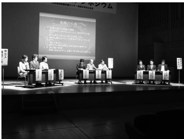
(調停期日最終日・和解の場面)

第4幕は、調停期日最終日のシーンである。具体的な和解内容を決定する場面である。ここでは、両社の落とし所として、過去の損害賠償を不問にする代わりにライセンス料を5パーセントに引き上げることになった。また、判決と同じ拘束力を持たせるため、調停手続きから仲裁手続きに移行して仲裁判断書を作成することとした。